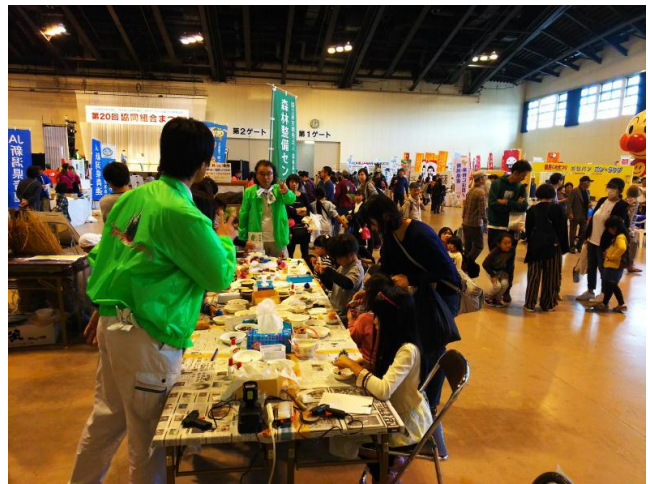
当センターのブース（木工教室）

当事務所のブースも開場と同時に親子連れの方で満員となり、終日客足の途絶えることがありませんでした。昨年よりも多く用意した松ぼっくりですが閉会前になくなり、ブースでは終了時間ぎりぎりまで一生懸命工作に没頭する親子の姿も見受けられました。