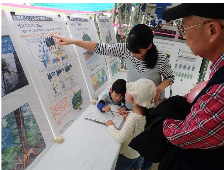
↑ 小さな子どもたちにもご参加いただきました