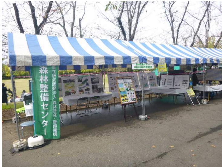
↑ 出展ブースの様子